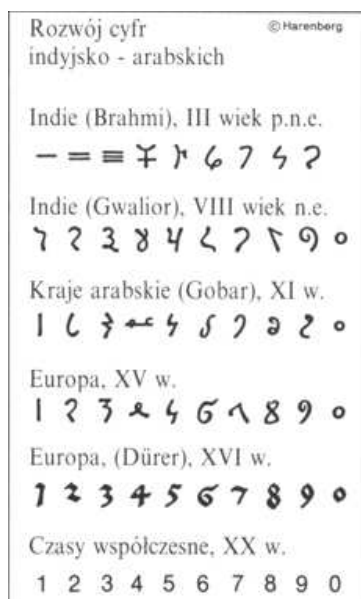
Rysunek 3: Rozwój cyfr indyjsko arabskich.